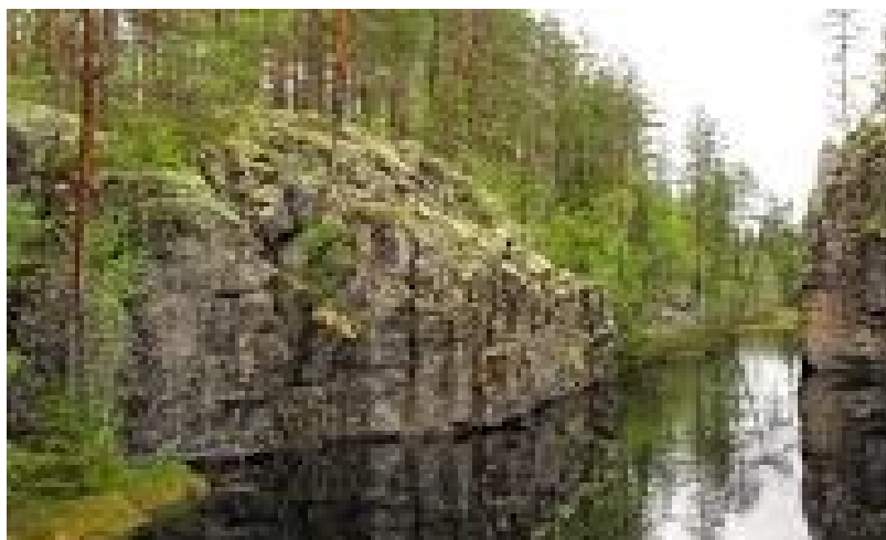
Фото 2. Фінський пейзаж.

Поєма Сібеліуса полюбилася киянам і не пішла з репертуару київського оркестру. Зокрема, О. Виноградський виконав її 26 січня 1904 року — і знов, як зазначали газети, вона «справила велике враження» 1 , а інтерес до фінської музичної культури отримав нові імпульси завдяки Роберту Каянусу, фінському композитору і диригенту, запрошеному до Києва 1902 року керувати літніми симфонічними концертами (фото 3).