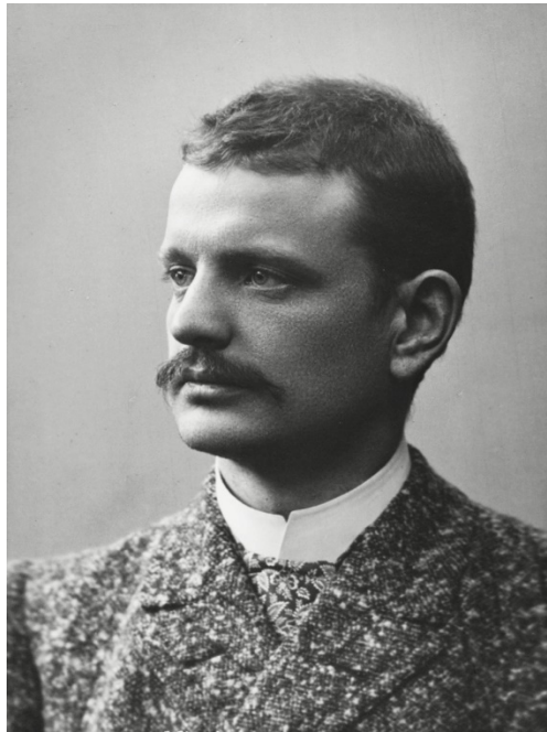
Фото 1. Ян Сібеліус. 1891 рік.

У характеристиці цієї «музичної легенди» (як назвав її критик) Чечотт виходить із особливостей емоційного звучання природного ландшафту Фінляндії: «Просторі туманні горизонти, наповнені сірими гранітами, з незліченними озерами і тьмяно освітленими лісами, схиляють глядача до глибокої задумливості. Похмуре забарвлення північних пейзажів накладає на них відбиток суворості і стриманої краси. <...> Така музична поема як «Туонельський лебідь» могла виникнути тільки у Фінляндії ... яка налаштовує на меланхолійне споглядання, не чуже містицизму. Технічні прийоми автора гармонують з його завданням та настроєм; оспівуючи лебедя, який урочисто пливе по водах, що оточують легендарне "царство мертвих" фінської міфології, Сібеліус усунув зі свого духового оркестру усі більш яскраві та світлі елементи верхніх регістрів (труби, флейти і кларнети), виділивши альтовий гобой як солюючий інструмент (спів лебедя), і утворив із струнної групи цілу фалангу скорботних голосів, розділивши їх на тринадцять, часом на чотирнадцять партій. Надзвичайно характерний і новий глухий гуркіт великого барабана, що підкреслює зловісним гулом лише деякі епізоди партитури» 1 .