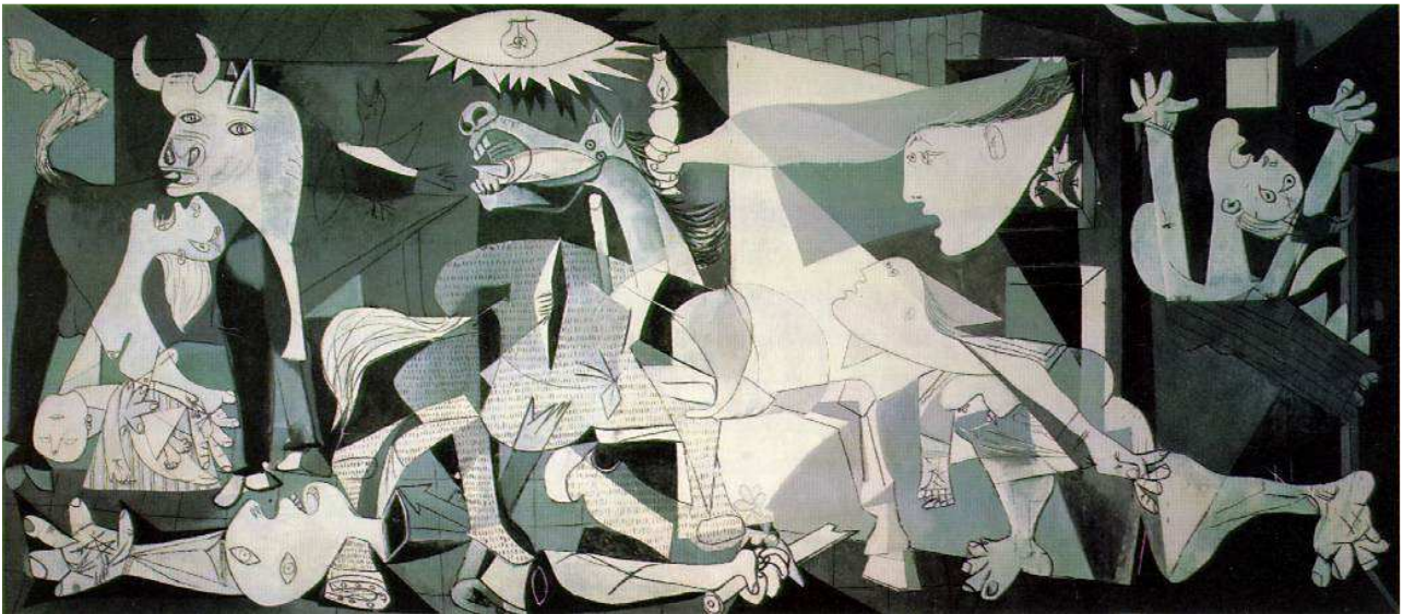
Ілюстрація 1. П. Пікассо. «Герніка».